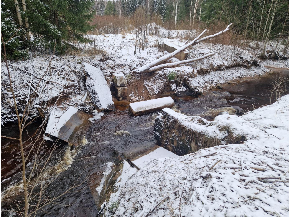
Joonis 1. Oraveski paisu (PAIS015990) seisukord jaanuar 2025.